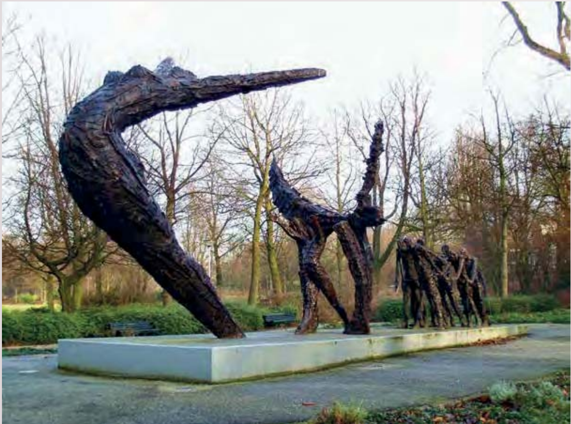
Slavernijmonument (Erwin de Vries)

om onze cultuur onder de kritiek te laten blijven van Gods spreken in zijn opdrachten aan man en vrouw. Dat gezag altijd gedeeld gezag is, en dat gezag altijd dienend moet zijn, is niet iets dat wij nu pas ontdekken. Dat vinden we in het onderwijs van de Here Jezus en van de apostelen. Voor hén was dat geen reden om aan mannen en vrouwen in het huwelijk en in de kerk een identieke verantwoordelijkheid te geven.