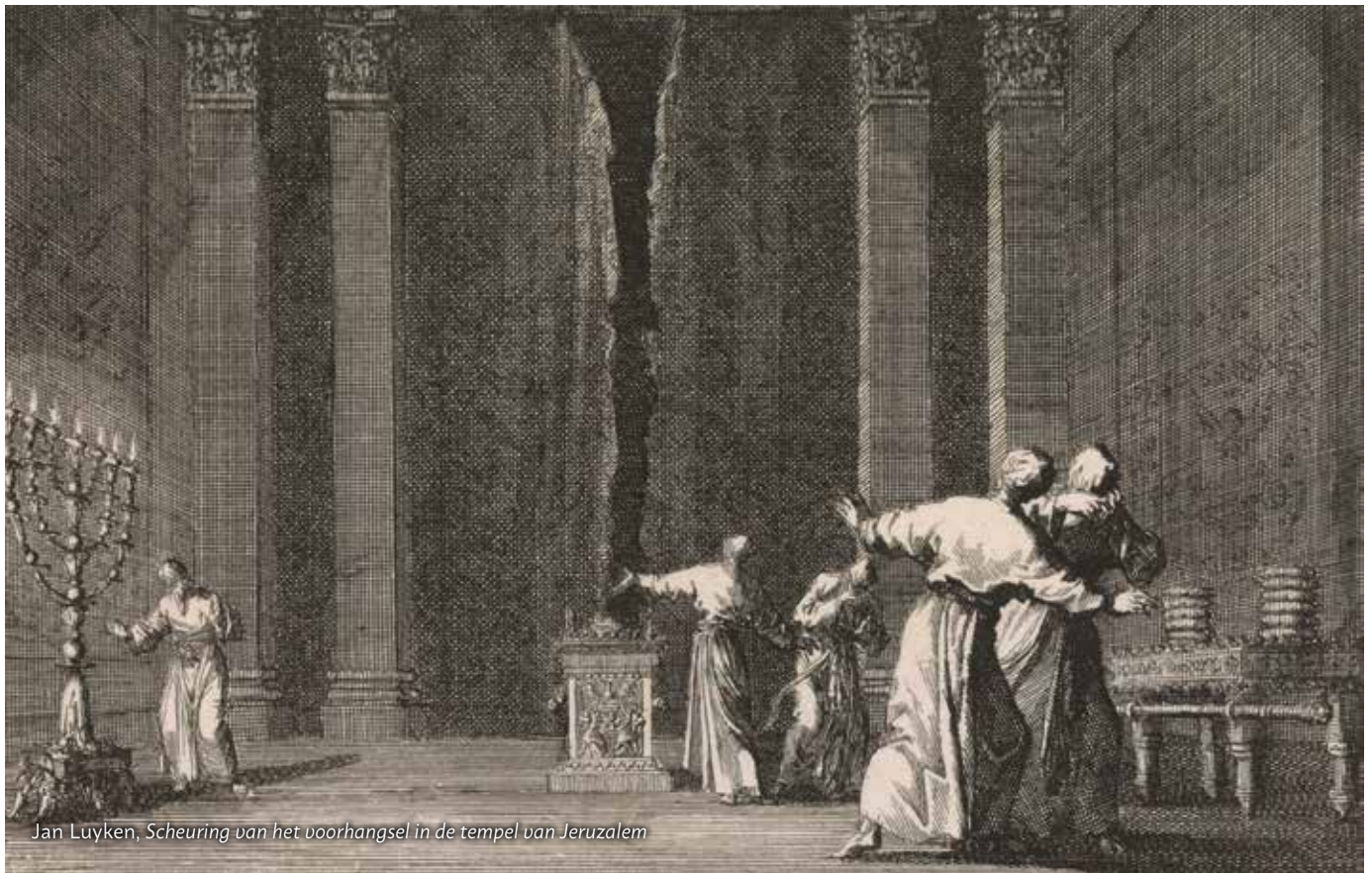
Jan Luyken, Scheuring van het voorhangsel in de tempel van Jeruzalem