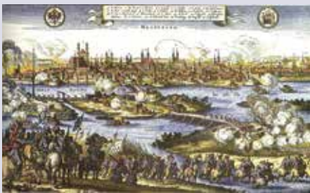
De inname van Maagdenburg door generaal Tilly

H et is zondagmiddag. Ik zit te lezen in het laatste deel van de (jeugd)roman Zoeken en zeker vinden . Het gaat over de strijd tussen de rooms-katholieken en de protestanten in Duitsland. Op de achtergrond draait een cd, de nieuwste van Sela. Opeens hoor ik het lied 'Huis van Vrede'. Even stop ik met lezen en ik luister. Ontroerd druk ik de herhaaltoets in en luister nog een keer. Ongelofelijk! Dit is het: de clou van het boek dat ik zit te lezen! Ja, hoe kan een mens zich vergissen! Toen ik het boek voor het eerst zag, dacht ik: Nee hè. Zo'n dikke pil voor jongeren? Ik las een paar bladzijden in het inblikexemplaar op de site van de uitgever en was heel kritisch: wat een taalgebruik af en toe! Kom ik daar doorheen? En is dit iets voor jongeren? Ik had zo mijn twijfels.