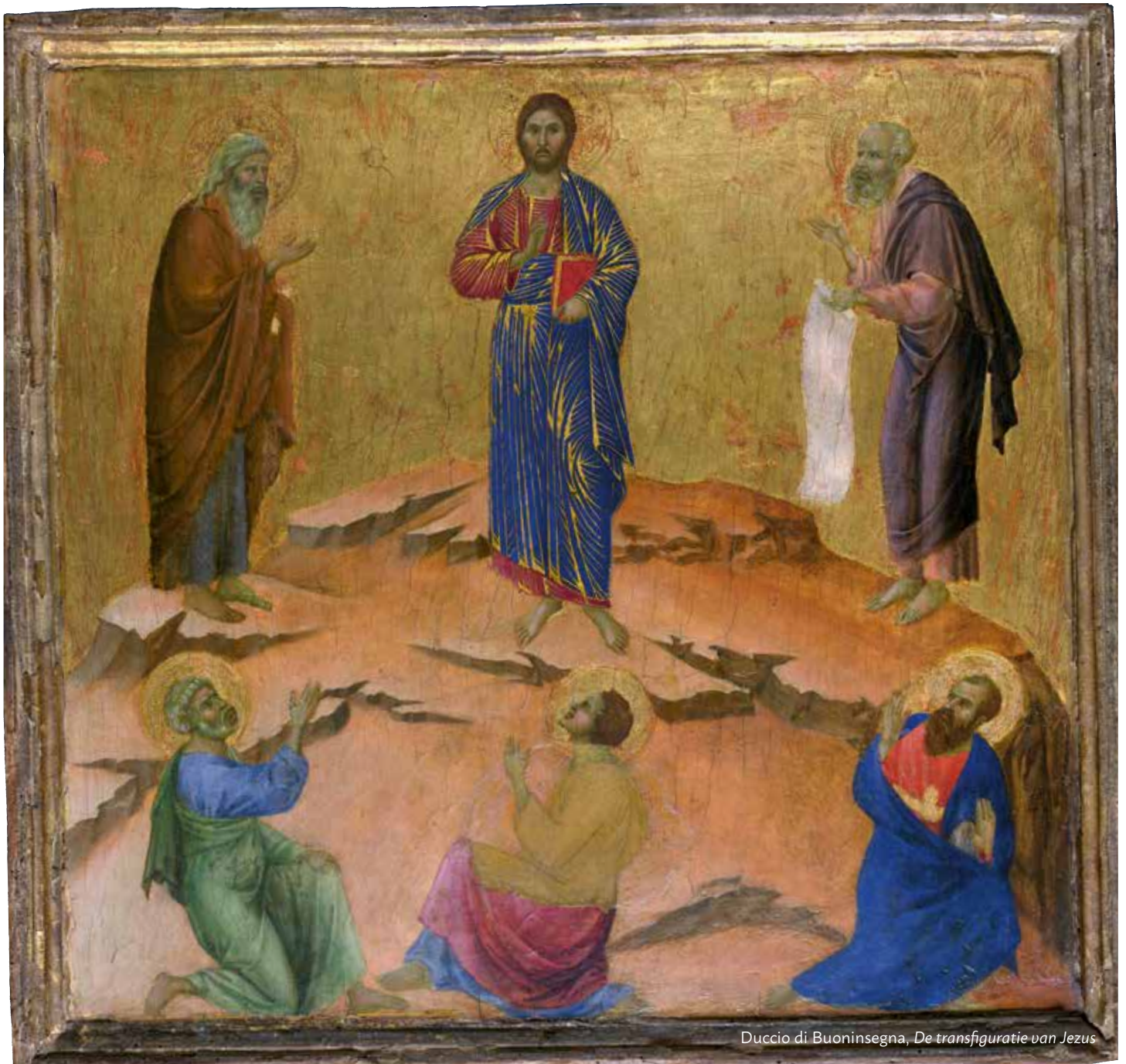
Duccio di Buoninsegna, De transfiguratie van Jezus