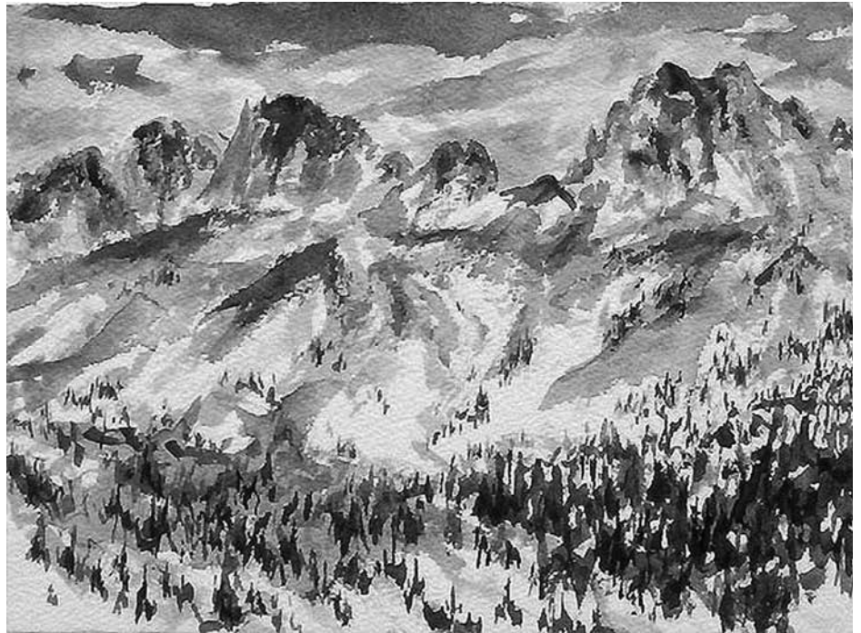
Hemel en aarde, aquarel van Patrick Myers

5. Het is goed om te lezen dat ds. Gunnink het citaat uit het studieprogramma bij een latere gelegenheid achterwege heeft gelaten. Zonder die stortvloed van moeilijke en mistige woorden is ook goed duidelijk te maken dat de wens er is, dat er ook vanuit Kampen duidelijk stelling genomen wordt in het debat rond de schepping. En die wens leeft ook bij mij. Ik besef dat zeker vanuit Kampen er niet gestreefd mag en moet worden naar eenvoudige machtswoorden. Een antwoord moet een goed doordacht antwoord zijn, vanuit de eigen aard van de verantwoordelijkheid van een docent te Kampen. Een ant-