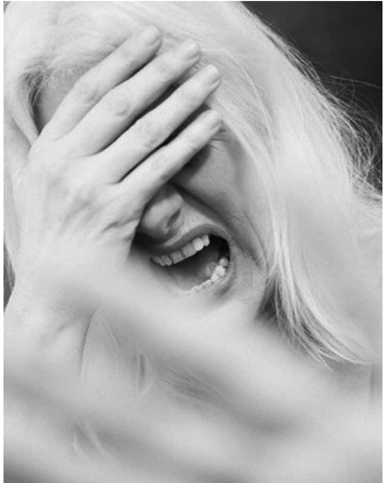
Ik ellendig mens

De les van de kerkgeschiedenis is dat zij die moeite hebben met Romeinen 7, vaak moeite hebben met het radicale van de genade. Dat radicale is dat God genadig is over mensen die zo heel ontzettend slecht zijn, dat ze er op geen enkele manier aan te pas komen. Arminius vindt dat moeilijk. Het gaat hem om de verantwoordelijkheid en (dus) de inbreng van de mens. Daarom moet die mens niet zo beroerd slecht zijn. Daarom vindt hij dat de erfzonde de natuur van de mens niet zo ontzettend slecht heeft gemaakt, dat er geen samenwerking meer zou kunnen zijn tussen de genade van God en de menselijke wil.