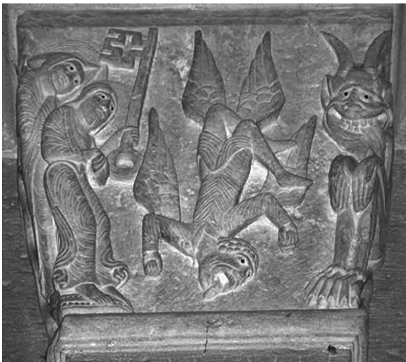
Val van Simon de tovenaars (kathedraal St-Lazare)

Nee, want Filippus predikt niet zichzelf, maar het rijk van God en de naam van Jezus (vs. 12). Hij laat horen en zien hoe het leven niet verlost wordt door hoogmoed. Integendeel, als jij nederig door de knieën gaat, dan pas word je blij. Christus alleen geeft diepe vreugde in het hart.