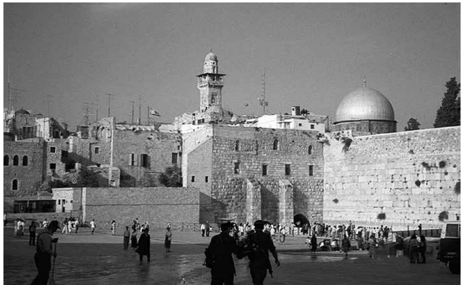
Jeruzalem (de Klaagmuur)

Gods verkiezing en verwerping. U leest erover in hoofdstuk I van de Dordtse Leerregels. Wat mooi, zoals de Leerregels daarbij de bijbelse lijn volgen! Alle mensen hebben in Adam gezondigd. God zou geen onrecht hebben gedaan als Hij dan ook besloten had alle mensen voor eeuwig te straffen (DL I, art. 1). Maar: God is liefde, Hij gaf zijn eniggeboren Zoon, opdat ieder die in Hem gelooft, niet verloren gaat maar eeuwig leven heeft. Woordelijk een combinatie van twee bijbelteksten! (art. 2). In zijn goedheid laat God nu de belofte van het evangelie verkondigen, waarbij