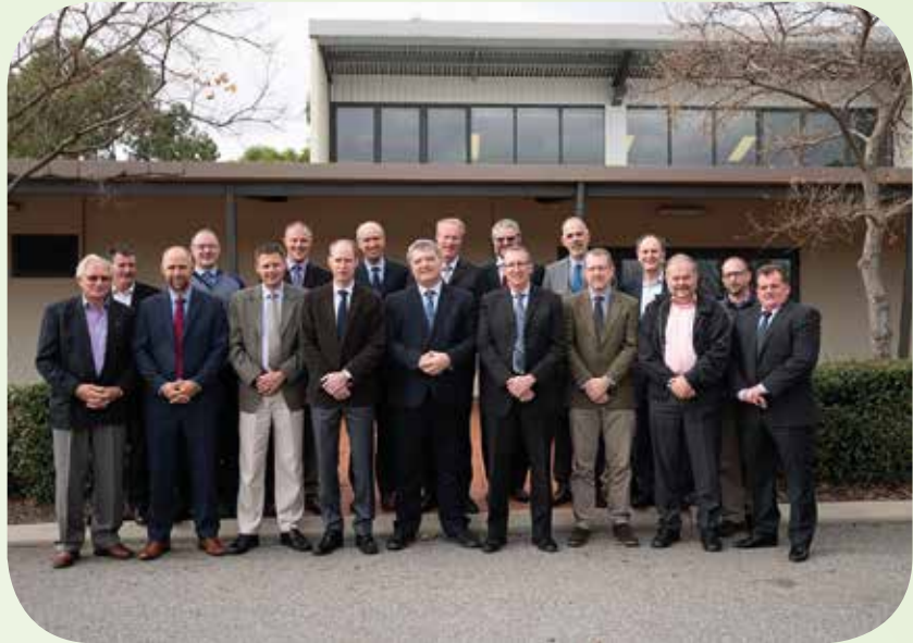
Afgevaardigden Synode 2018 FRCA

uitgesproken dat er geen Bijbelse grond is voor toelating van de vrouw tot het ambt van ouderling en predikant. Ook in gesprekken met andere buitenlandse afgevaardigden kregen we veel vragen en hoorden we waarschuwingen dat we het Bijbelse spoor niet moeten verlaten. De Orthodox Presbyterian Church uit