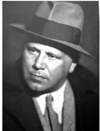
Willem de Mérode